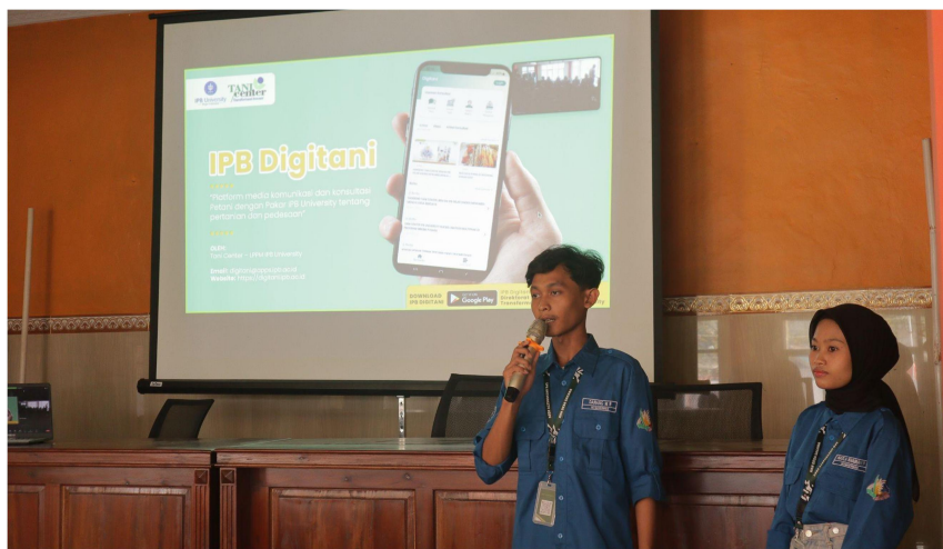
Gambar 4. Sosialisasi aplikasi IPB Digitani

penyuluh pertanian, dan akademisi IPB yang dikelola oleh Tani Center IPB selaku Lembaga Penelitian dan Pengabdian kepada Masyarakat (LPMM) IPB (Bellini 2023). IPB Digitani memiliki 8 fitur yang terbagi kedalam 2 kategori, yaitu fitur konsultasi dan fitur informasi. Pada fitur konsultasi terdapat fitur konsul tani, forum tani, tanya pakar, dan daftar penyuluh. Sedangkan pada fitur informasi terdiri dari artikel pertanian dan pedesaan, video podcast dan tutorial, artikel konsultasi, serta berita. Dengan adanya IPB Digitani memudahkan petani untuk berkonsultasi mengenai kejadian di lahan pertanian mereka dengan penyuluh dan pakar pertanian.