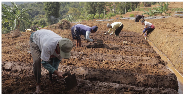
Gambar 2. Kegiatan Masyarakat Desa Sagara

Desa Sagara terletak di Kecamatan Argapura, Kabupaten Majalengka, Jawa Barat. Desa Sagara didominasi oleh penduduk dengan rentang usia 25-40 tahun. Total penduduk mencapai 1667 jiwa diantaranya terdapat laki-laki berjumlah 826 jiwa dan perempuan berjumlah 841 jiwa. Mayoritas penduduk desa Sagara memeluk agama islam dan berprofesi sebagai petani. Desa Sagara termasuk dalam kategori daerah dataran tinggi dengan ketinggian \pm 600-800 meter dari permukaan laut (mdpl). Curah hujan rata-rata mencapai 220 mm per tahun, cukup untuk mendukung kegiatan pertanian sepanjang tahun. Dengan kondisi wilayah tersebut, tanah di desa ini tergolong subur, cocok untuk berbagai jenis tanaman pangan dan hortikultura. Oleh karena itu, 80% masyarakat desa ini sangat bergantung pada sektor pertanian sebagai sumber utama mata pencaharian mereka. Sebagian besar lahan di Desa Sagara digunakan untuk menanam padi, bawang merah, daun bawang, singkong dan berbagai tanaman hortikultura lainnya. Masyarakat Desa Sagara masih bertani dengan metode bercocok tanam yang telah diwariskan dari generasi ke generasi. Petani di sini umumnya menggunakan cara-cara tradisional dalam Bertani, sebagaimana Gambaran aktivitas Bertani di Desa Sagara tersaji pada Gambar 2.