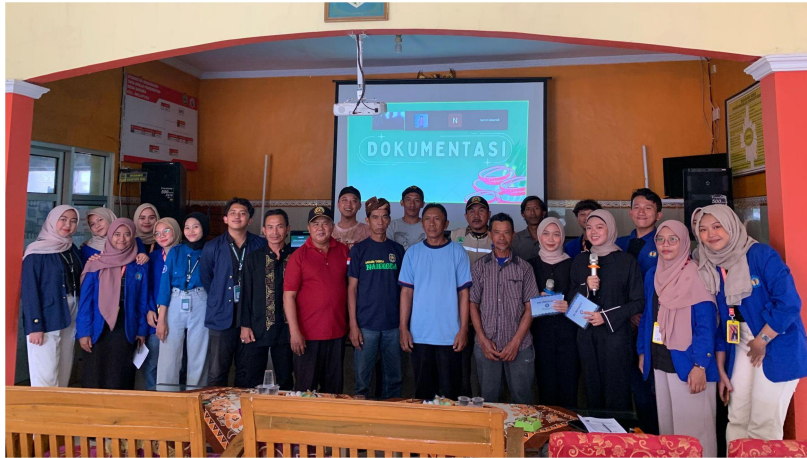
Gambar 6. Dokumentasi Kegiatan BERTAMASA