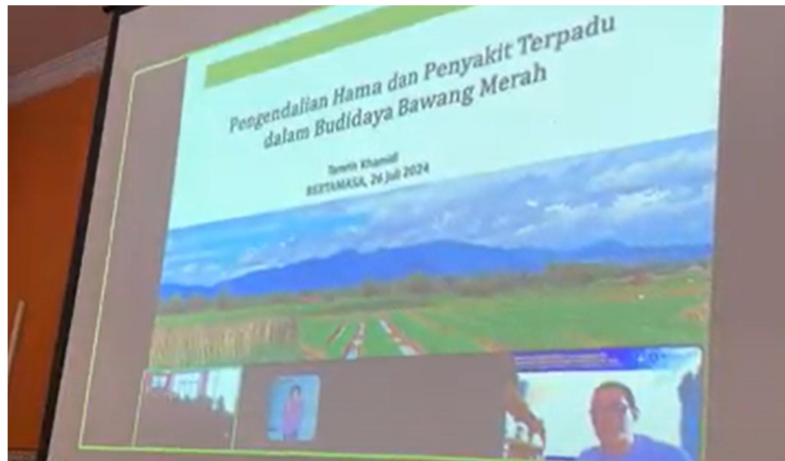
Gambar 3. Pemberian Materi Pengendalian Hama Terpadu

IPB DigiTani adalah platform digital yang dikembangkan oleh Institut Pertanian Bogor (IPB) untuk mendukung petani dalam mengakses informasi pertanian secara mudah dan efisien. Platform ini dirancang untuk memfasilitasi transfer teknologi dan pengetahuan dari IPB kepada para petani, dengan tujuan meningkatkan produktivitas dan kesejahteraan petani di Indonesia. IPB DigiTani menyediakan berbagai layanan, seperti informasi cuaca, harga komoditas, teknik budidaya, serta manajemen usaha tani, yang semuanya dapat diakses melalui aplikasi mobile atau situs web. Sejarah IPB DigiTani dimulai sebagai respons terhadap kebutuhan modernisasi sektor pertanian di Indonesia. Dalam menghadapi tantangan globalisasi dan perubahan iklim, IPB melihat pentingnya memanfaatkan teknologi digital untuk meningkatkan kapasitas petani dalam mengelola usaha tani mereka. Program ini diluncurkan dengan tujuan mendekatkan ilmu pengetahuan dan inovasi yang dikembangkan di IPB kepada masyarakat luas, khususnya petani. Melalui IPB DigiTani, IPB berupaya menjembatani kesenjangan informasi antara petani dan teknologi pertanian terbaru, dengan harapan menciptakan ekosistem pertanian yang lebih tangguh dan berkelanjutan.